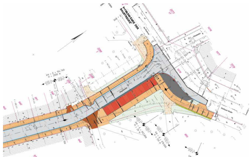
Neubaugestaltung der Gehweg-, Park- und Fahrbahnflächen