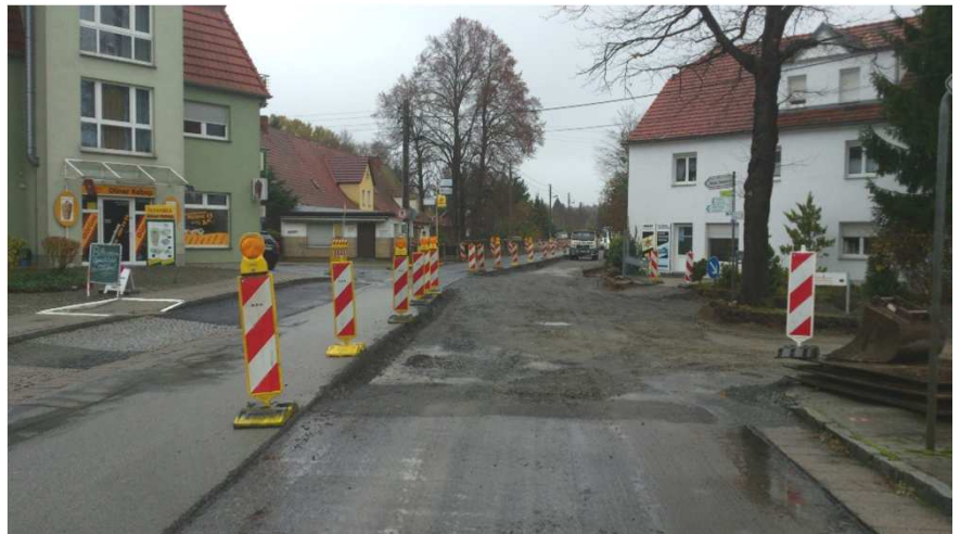
Ausbaubereich mit Gradientenabsenkung und Einmündungen