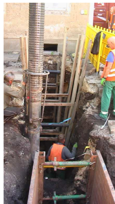
Lichthärtungskette für Inlinereinzug Stadttechnik ...