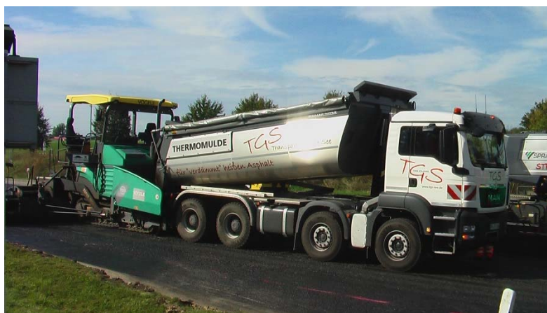
Mischguttransport mit Thermomulde