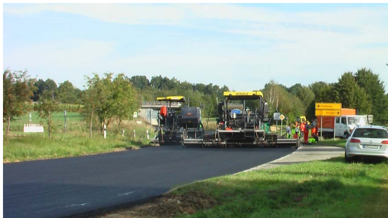
Bindereinbau heiß an heiß mit 2 Fertigern