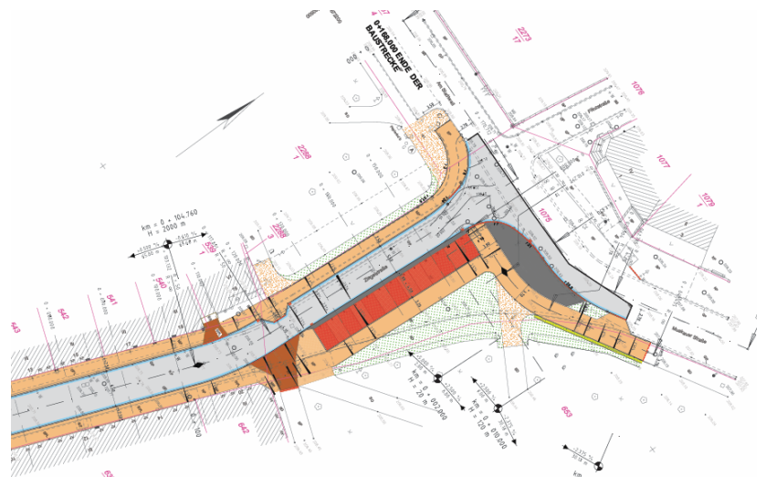
Neubaugestaltung der Gehweg-, Park- und Fahrbahnflächen